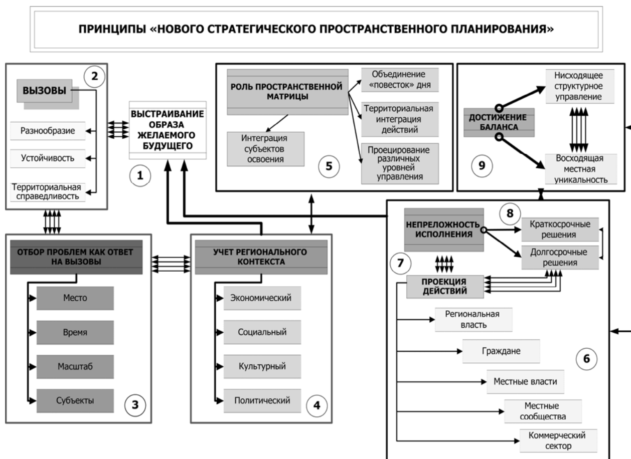
Рис. 3. Принципы стратегического пространственного планирования

Е. Территория и ландшафты – ключевые аспекты стратегического планирования, ибо в пределах дифференцированного пространства объединяются между собой «повестка дня» (как достигнутое понимание важности тех или иных проблем), действия различных уровней управления (регионального местного) и инициативы гражданского общества.