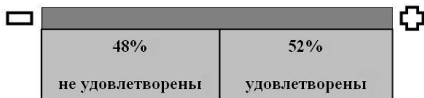
Рис. 1. Удовлетворенность студентов своей успеваемостью

Представляет определенный интерес и перспективу для совершенствования успешности обучения ответ на вопрос: «Удовлетворены ли Вы своей успеваемостью?» (рис.1)