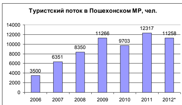
Рис. 1. Туристский поток в Пошехонском муниципальном районе за 2006–2012гг.

По данным администрации Пошехонского муниципального района (2012 год – данные за 9 месяцев)