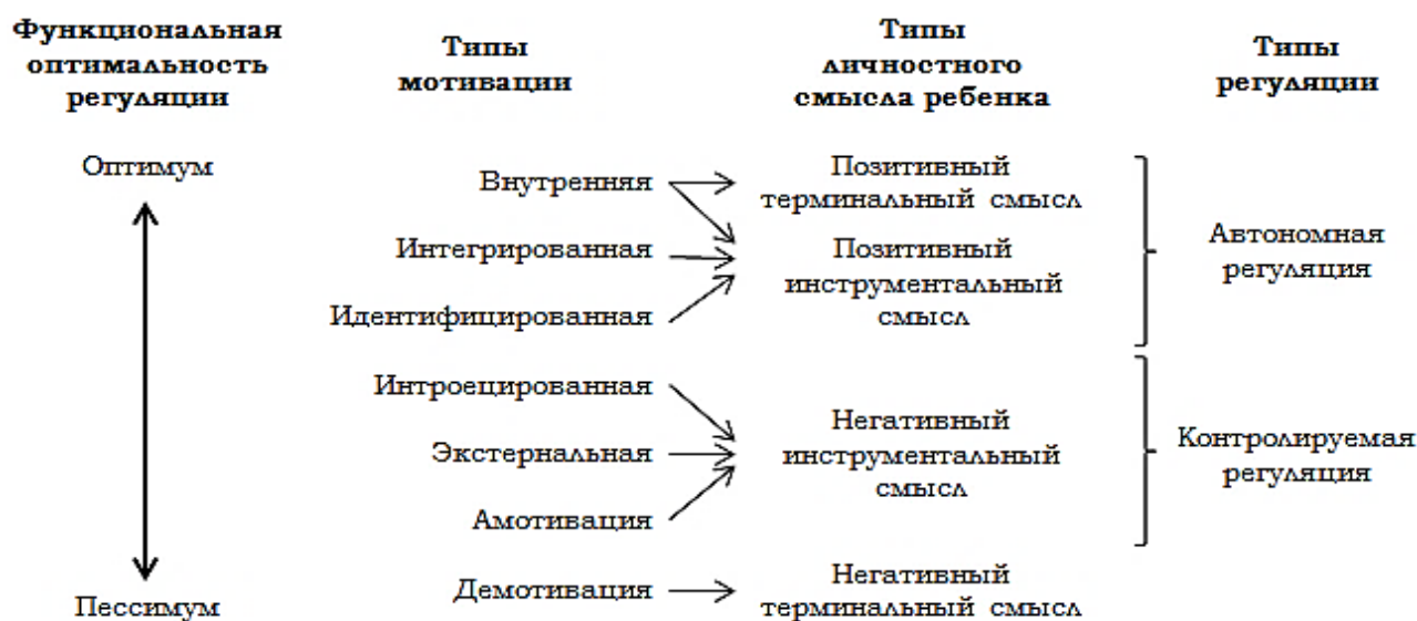
Рисунок 1. Психологические типы личностного смысла ребенка в континууме мотивации профессиональной педономической деятельности