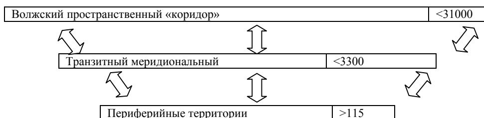
Рис.3. Производство промышленной продукции в ареалах преимущественного социально-экономического развития и в периферийных территориях (2000 г., млн. руб.)*. Рассчитано по материалам Ярославского обл. комитета гос. статистики. *Примечание: получение точных сведений представляется проблематичным из-за отсутствия достаточной информационной базы.

состав двух ареалов развития и расположенных вне их территорий. Промышленный «вес» выражен в производстве промышленной продукции и разительно отличается (рис.3).