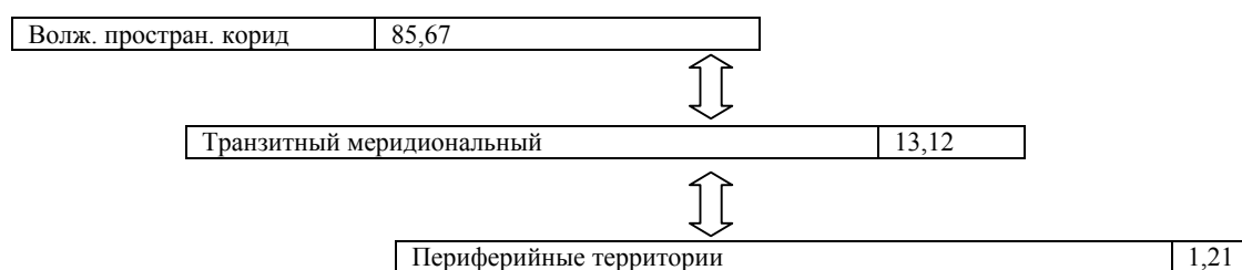
Рис.2. Соотношение количественной концентрации городского населения в ареалах преимущественного

деятельности предоставляет экономические и социальные преимущества для территорий. Для подтверждения сказанного на рис.2 для каждого ареала и периферийных муниципальных округов рассчитана доля наличного городского населения.