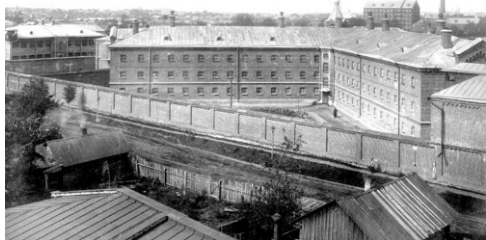
Рис. 1. Коровницкая тюрьма, 1920 г. [7]

9. Большая медицинская энциклопедия [Электронный ресурс]. – Режим доступа : http://bigmeden.ru/