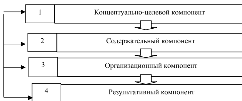
Структурно-компонентная модель ППП