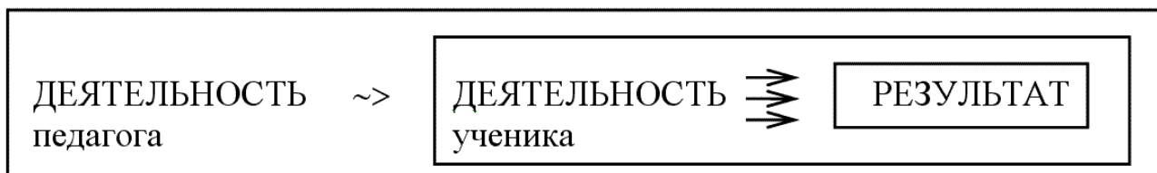
Рис. 1. Мета модель педагогического процесса

из которых предполагает наличие цели, средств, способов и результата. «Главная социальная функция образования – передача опыта, накопленного предшествующими поколениями людей. ...Он представляет собой деятельность, воплощенную в знаниях, умениях, творчестве и отношении к миру» [5, с. 101].