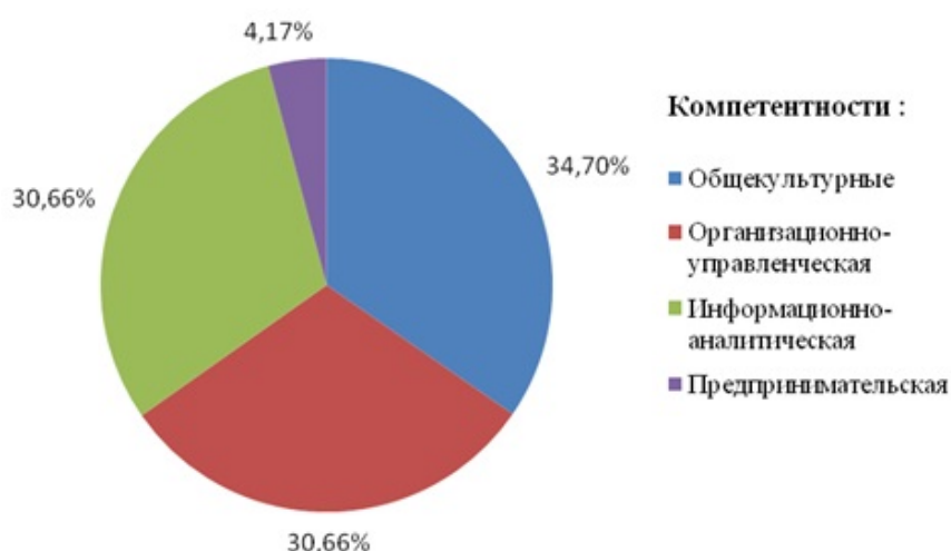
Рис. 1. Соотношение компонентов подготовки бакалавров направления «менеджмент» (в соответствии с требованиями ФГОС ВПО)