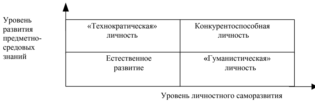
Рис. 1. Модель конкурентоспособной личности

Для практического исследования уровня конкурентоспособности конкретного учащегося предлагается схема, основанная на двумерном подходе к пониманию рассматриваемого свойства личности.